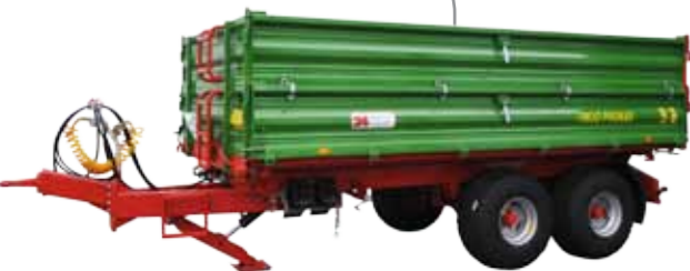
PRONAR T663/1 SILO