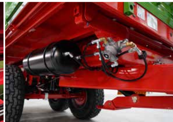
Widerstandsfähige Stahlprofile (rechteckig geschlossen)