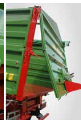
Bordwand und Aufsatz mit Pendelfunktion