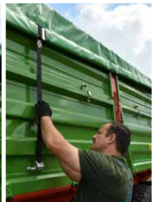
Rollplane mit Spanngurten zur Befestigung