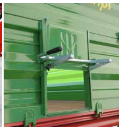
Rückwand mit dichtem Kornschieber