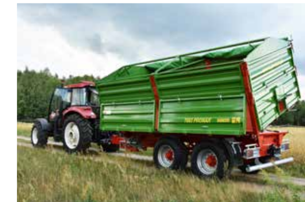
Größtes Modell im Sortiment der Tandem-Dreiseitenkipper