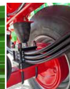
Hoher Fahrkomfort durch Parabelfederung