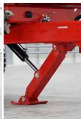
Serienmäßiger hydraulischer Schrägstützfuß