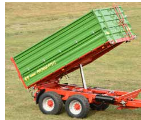
Effektives Kippen dank des zuverlässigen Teleskopzylinders