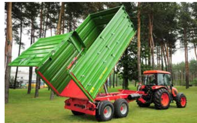
Ladevolumen bei der SILO-Version mit hydraulischer Heckklappe auf 15,7 m³ erhöht