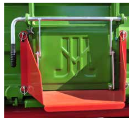
Auslaufgasse erleichtert die Entladung