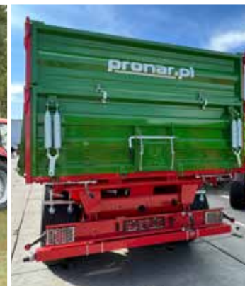
Serienmäßig montierte Bordwandbefedern ermöglichen eine effiziente Bedienung