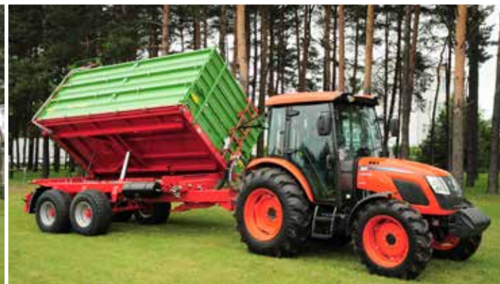
Ladekiste mit universalem Öffnungssystem und trapezförmigem Boden (Heckverbreiterung um 50 mm)