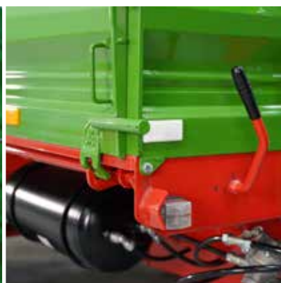
Dreiseitige Verriegelung erleichtert die Bordwandöffnung