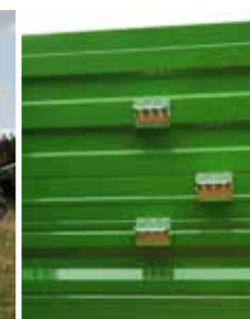
Bordwandstufen erleichtern den Zugang zur Ladekiste