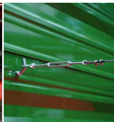
Spannselle im Detail