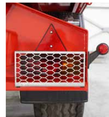
Rücklichter mit Schutzgitter