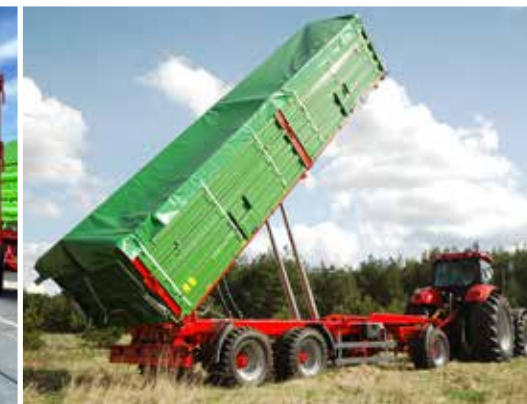
Starkes Kippssystem zur Arbeitserleichterung