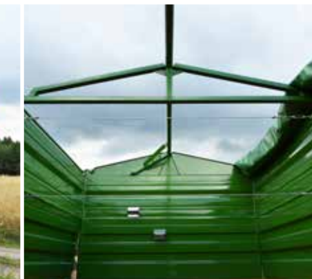
Spannselle zwischen den Mittelrungen als zusätzliche Verstärkung der Bordwände