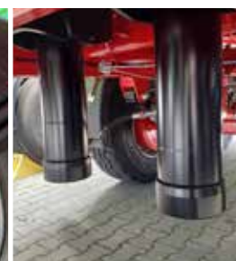
Zwei Teleskopzylinder zur zuverlässigen Entladung