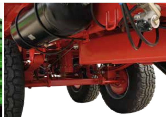
Tandemachsen mit Parabelfederung und entsprechender Spurbreite ermöglichen souveränes Manövrieren auf herausforderndem Gelände