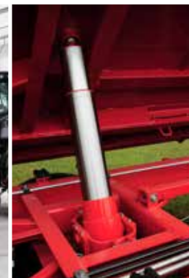
Vierstufiger Teleskopzylinder ermöglicht problemloses Kippen