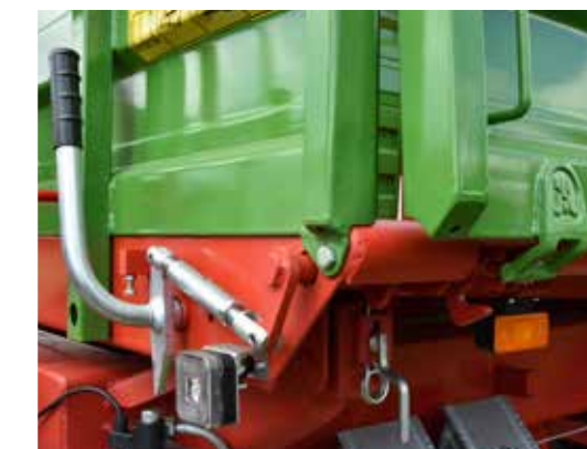
Dreiseitige Verriegelung zur Erleichterung der Bordwandöffnung