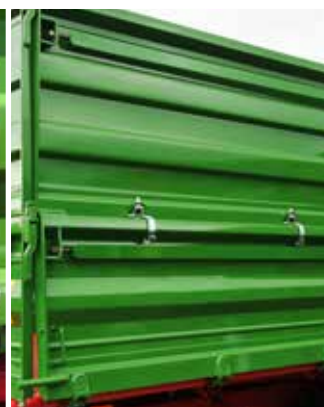
Spannleisten zur Stärkung der Bordwände