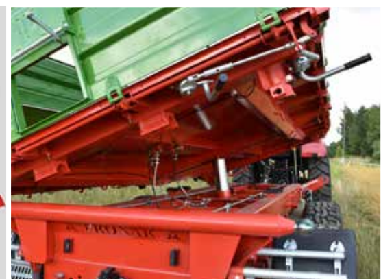
Kippsystem mit gefederten Kugelgelenken (heckseitig)