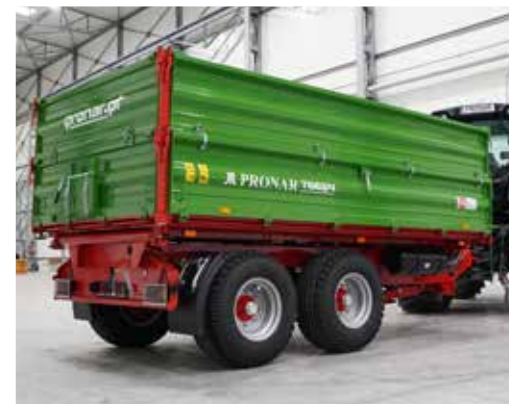
Begünstigte Beladungsverhältnisse dank niedriger Plattformhöhe