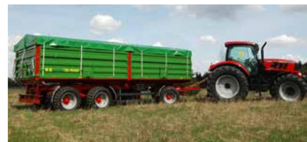
Größtes Modell im Sortiment der Dreiachs-Dreiseitenkipper