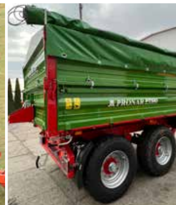
Gesicherter Transport des Ladegutes mittels optionaler Rollplane