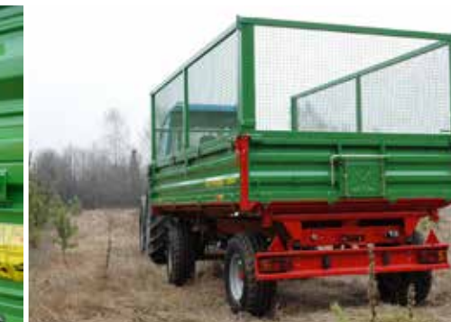
Gitteraufsätze (1000 mm) zum sicheren Transport von leichtem Grobmaterial