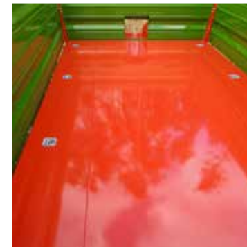
Zurrösen im Anhängerboden verankert