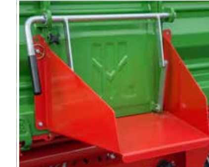
Auslaufgasse als Option

*Die aufgeführten Parameter betreffen die Version mit Druckluftbremse. Version mit Auflaufbremse ebenfalls erhältlich