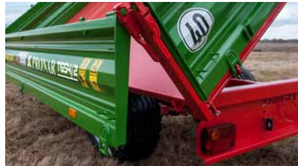
Kippwinkel: nach hinten 50°, nach links und rechts 46°

*Alle aufgeführten Parameter betreffen die Version mit Druckluftbremse. Version mit Auflaufbremse ebenfalls erhältlich **Nur bei Einzelabnahme in DE. Beratung erforderlich