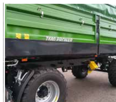
Seitliche, klappbare Blechrutsche (links o. rechts), erleichtert das Entladen