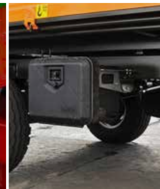
Werkzeugkasten als praktische Option