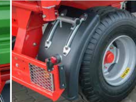
Kotflügel auf der Hinterachse und Rücklichter mit Schutzgitter