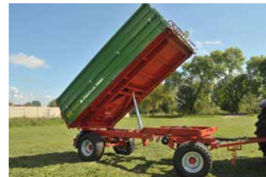
Ladekiste mit dreiseitigem Öffnungssystem und konischem Boden (Anhängerbite erweitert sich heckseitig um 50 mm)