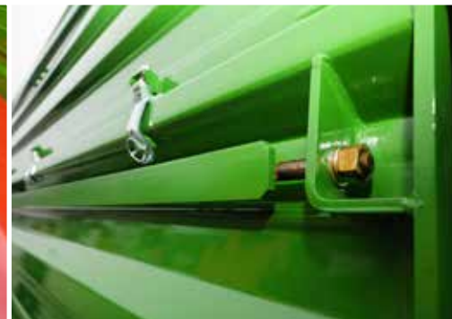
Spannleisten zur Stärkung der Bordwandprofile