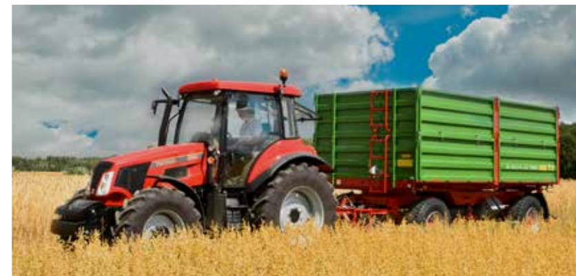
T680 mit geteilten Bordwänden bei der Ernte