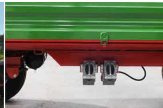
Radkeile mit sicheren Haltevorrichtungen als serienmäßige Ausrüstung