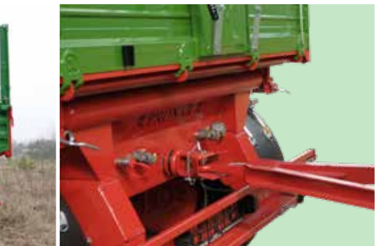
Hintere Anschlüsse zur sicheren Fahrt mit zwei Anhängern