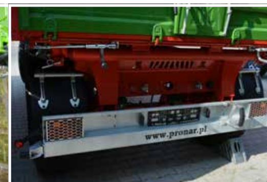
Hintere Stoßstange mit integrierten LED Rückleuchten (gesichert durch abnehmbare Gitter)