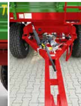
Y-Deichsel mit Zugöse Ø40 starr