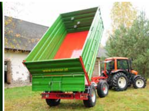
PT612 verfügt über ein Dreiseiten-Kippsystem