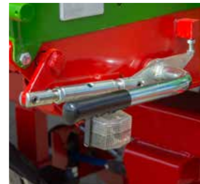
Zentralverriegelung an drei Seiten zur Erleichterung der Bordwandöffnung