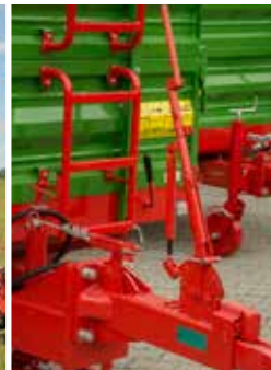
Auflaufdeichsel mit starrer Zugöse Ø40