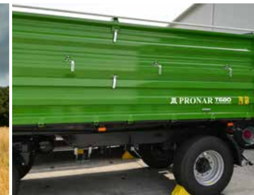
Auf Wunsch bieten wir beim Modell T680 durchgehende Bordwände an