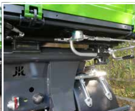
Hydraulische Bordwandverriegelung zur Erleichterung der Entladung (Option)