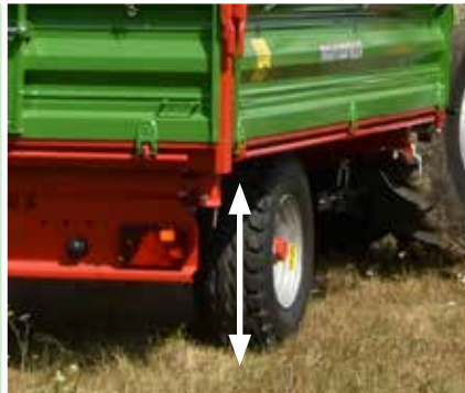
Niedrige Plattformhöhe erleichtert das Beladen