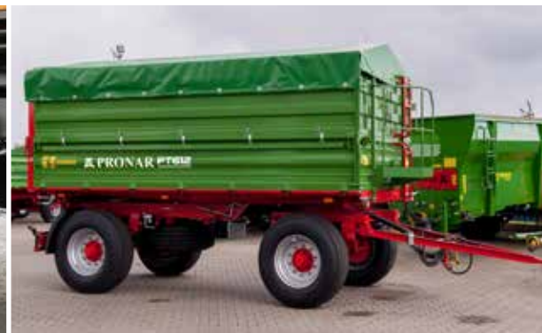
PT612 mit Rollplane, Gestell (klappbar) und Podest